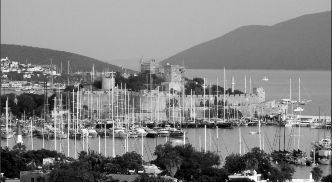
Şekil 1 Bodrum Kalesi ve Yat Limanı

Ülkeye uzun vadede fayda sağlayan sürdürülebilir turizm, devlet ve özel sektörün birlikte çalışabileceği durumda mümkündür. Çevreyi korumanın sorumluluğu ile doğal ve kültürel mirasın korunması tamamen yerel halkın elinde bırakılmamalı, ancak tüm ilgili kişiler, halk, özel kuruluşlar, hükümet ve turistler tarafından karşılanmalıdır (Cater ve Lowman, 1994).