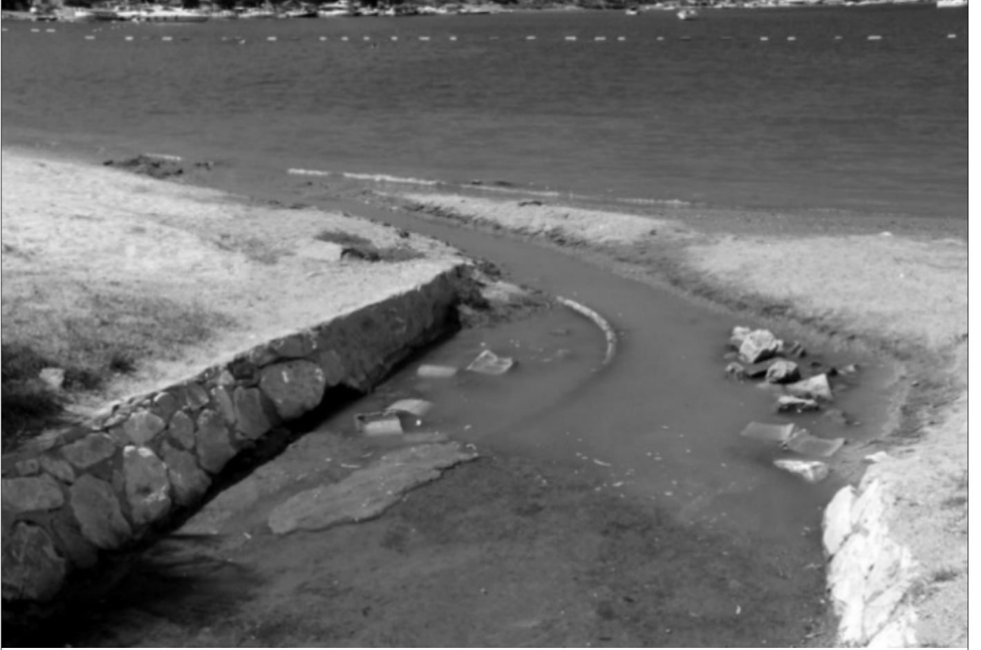
Şekil 3 Gümbet Sahiline Dökülen Dere

Sürdürülebilir kalkınmayı desteklemek kamu yararınadır, ancak hızlı turizm kalkınması için itici güç buna karşı çalışır (Elliot, 1997). Bodrum, gözde tatil yöresi olması sebebiyle dış ülke ve şehirlerden gelen insanların arazi ve ev talepleriyle karşı karşıya kaldığından düzensiz bir şehirleşme örneği olarak karşımızda dimdik durmaktadır. Daha Yokuşbaşı'ndan başlayan düzensizlik ilçenin tüm mahallelerine yayılmaktadır. Konacak ve civarında antik tiyatro yolu üzerinde açılan alışveriş merkezleri, mağazalar ve büyük marketler Bodrum'un doğal yapısıyla uyuşmamakla birlikte her türlü sektörden gelen talepler neticesinde bu oluşumun önü kesilememektedir. İstanbul'u Bodrum'a taşıyan oportünist zihniyet Bodrum'u da yaz-kış yaşanan küçük İstanbul'a çevirmiştir. Bu durum sürdürülebilirlik kavramıyla bağdaşmamaktadır.