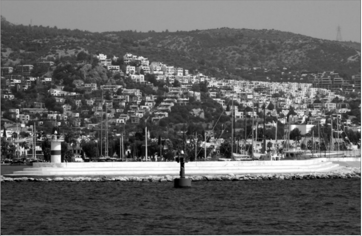
Şekil 4 Bodrum'da Yapılaşma Denizden Görünüş