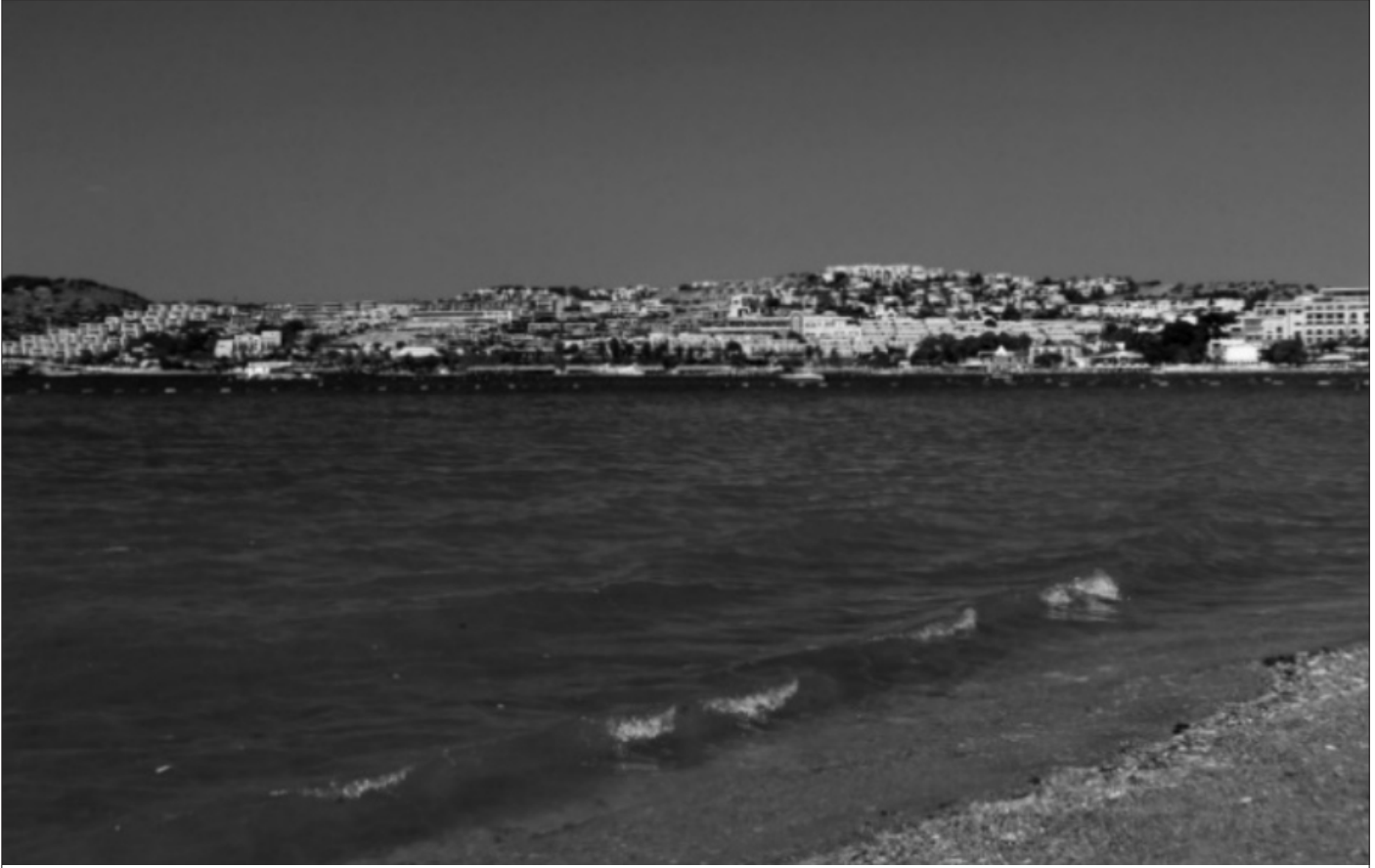
Şekil 2 Gümbetleşme

uzanan yarım daire planlı bir yapıdır. Mavsoleion Anıtı, dünyanın yedi harikasından biri olarak Mavsoleionun yükseldiği yer, bugün bir çukur olarak görülür. Taban ölçüleri 32x38 olan Mavsoleion bir zamanlar uzun kenarı 105 metre olan geniş bir alanın kuzeydoğu köşesinde yükselmekte ve dört bölümden oluşmaktadır (T.C. Kültür ve Turizm Bakanlığı, 2019). Pedesa Antik Kenti, antik dönem Leleg yerleşimi olan kent, Bodrum Konacık mahallesinin üst kısımlarında kurulmuştur. Halen kazı çalışmaları devam ettiğinden ziyarete kapalıdır. Gerekli düzenlemeler yapıldıktan sonra bölgede kültür turizminin en önemli uğrak yerlerinden biri olacağı kesindir.